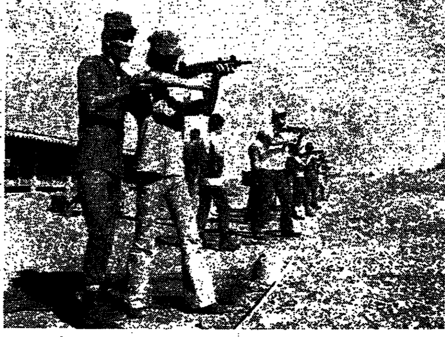
תלמידי טכניון וסמינר מקבלים אימון מיוחד לתפקידי הנסוח, שקיפה הגנה על בתי ספר במסגרת המבצע.

פרסום נוספים אצל הרב סגל. פרסום נוספים אצל הרב סגל. פרסום נוספים אצל הרב סגל.